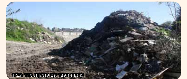
ערמות העפר עם עתיקות מהר הבית

מאוד מאוד חמור על מה שקורה בהר הבית והמדינה הפכה עולמות כדי שלא יפרסמו את הדוח הזה".