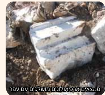
ממצאים ארכיאולוגיים מושלכים עם עפר

"הטענות שלנו הם כלפי המשטרה, אבל אנחנו מניחים שהמשטרה לא פועלת 'בוואקום'. היא מקבלת הנחיות, ואנחנו דורשים שההנחיות האלה יהיו כפופות להחלטתו של בית המשפט העליון. מדינת ישראל היא הריבון החוקי על הר הבית, והיא איננה מפעילה את הריבונות שלה כדי למנוע את המשך הנזקים לעתיקות בהר הבית. זה שהוואקף המוסלמי לא מונע שם הרס זה לא מעניין אותי, אבל רשות העתיקות וכל הגורמים ממשרד ראש הממשלה שותקים. יש איזו תחושה, אני לא יודע אם זה בכוונה או לא, אבל או שאנשי הוואקף מסבגים את המשטרה, או שיש שם שיתוף פעולה, או שיש שם הנחיות מלמעלה להעלים עין".