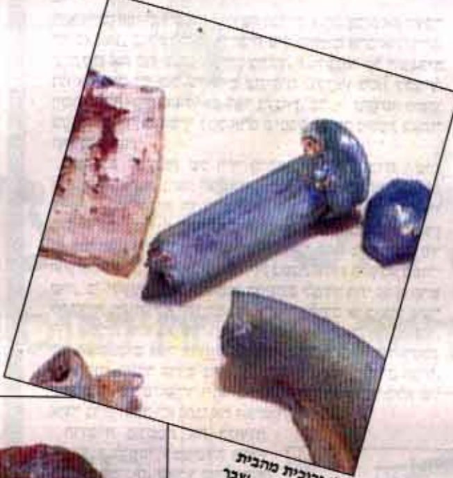
כלי זכוכית מתבית השני. במרכז - שבר של נר זכוכית