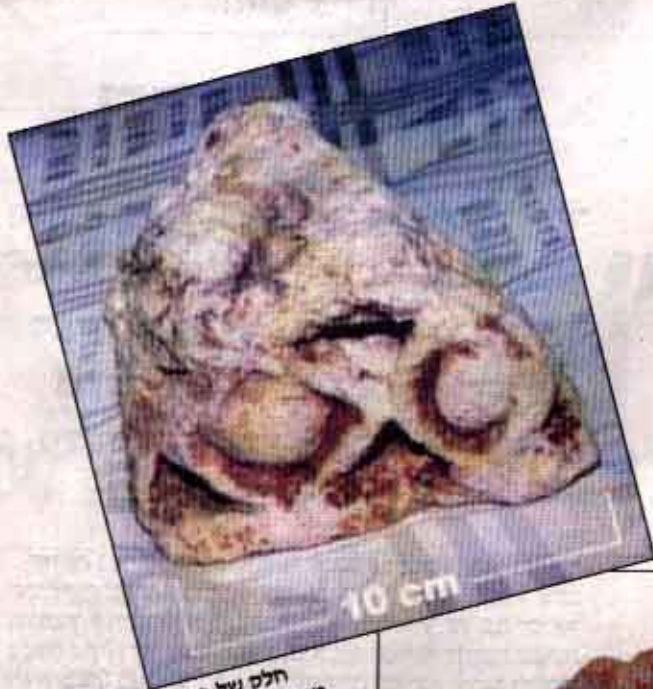
חלק של כרכוב ממבנה מוטומנטלי. עיטור זה הינו יחידאי

יהודה עציון ואנשיו, שמתצפתים קבוע על הנעשה בהר, הפנו את צויג לנחל קדרון. צויג הגיע למקום עם עוד שני חברים, שהחלו לחטט בעפר ודלו כ-30 חרסים. הסטודנט הצעיר לארכיאולוגיה דיוו