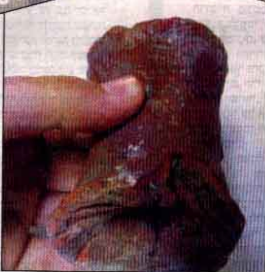
שבר של צלמית עמוד מנופצת מתקופת הבית הראשון

ממצאים ארכיאולוגיים נדירים שנמצאו בשפך האשפה בקדרון